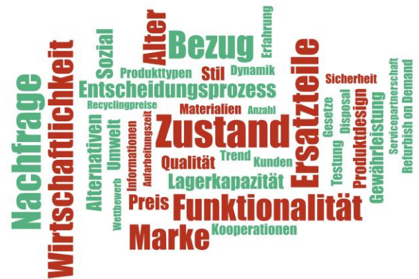
Abbildung 1: Ergebnisse der Interviews